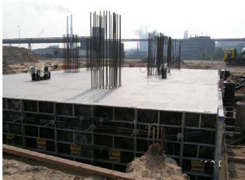
Bild 3 Kabelschutzrohre im Fundament nach dem Betonieren