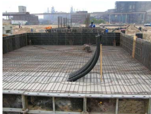
Bild 2 Kabelschutzrohre im Fundament

Für Wanddurchführungen in WU Beton sind spezielle wasserdruckfeste Muffen erhältlich. Gute Ergebnisse zur Abdichtung werden auch mit Doyma Dichtungen erzielt. Doyma bietet Spezialfaserzement Futterrohre für den Einbau in der Beton -wand oder -decke an. Sind diese nicht verfügbar, können mithilfe von Bordmitteln ebenso PVC-Rohre eingebaut und einbetoniert werden ( Abb. 1 ). Der Durchmesser der PVC Rohre muss aber so gewählt werden, dass der Doyma Dichtring und die Leerrohrmuffe aufeinander abgestimmt sind. Nach dem Ausschalen und Entfernen der PVC Form wird die Kabelleerrohrmuffe durch Verschrauben der Doyma Dichtung wasserdicht geschlossen. Planerisch sollten die Rohre nur rechtwinklig auf die Wand zulaufend eingebaut werden. Schräge Durchbrüche sind so gut wie nicht mehr abdichtbar. Mehrlagige Reihen von Kabelleerrohren durch die Betonwand sollten ausreichend Abstand zueinander haben (ca. 1x dm) um zum einen eine gute Bewehrungsführung sicherzustellen und zum anderen einen vollkommenen dichten Verguss des Betons zu ermöglichen.