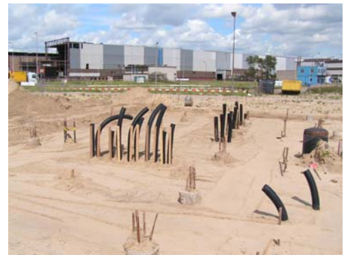
Bild 1 Kabelschutzrohre im Fundament

Für die Verlegung von Kabelleerrohren im Fundament Bild 1-3 sind insbesondere an Ausgängen an der Betonoberseite zu den Maschinenkomponenten genaue Lagevermessungen erforderlich. Beim Verlegen sind die Mindeststradien einzuhalten.